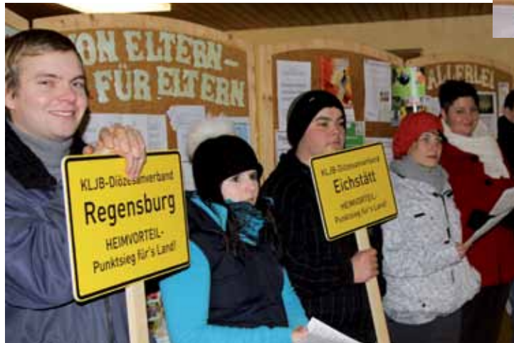
Zweite Station beim Gottesdienst: Der Don-Bosco-Kindergarten in Benediktbeuern bekommt von uns einen Segen für seine Arbeit.