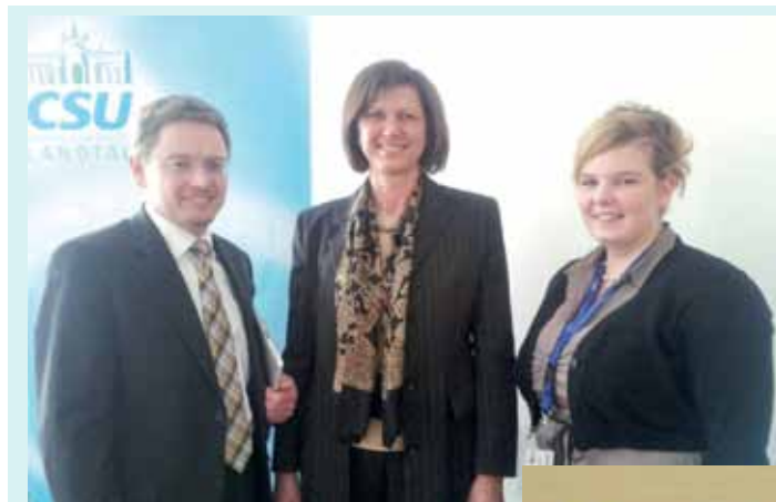
AK-LÖVE-Sprecherin Vroni Hallmeier traf beim „Landtag live“-Start am 5. März gleich mit ihrem Abgeordneten Tobias Reiss (CSU) zum Mittagessen auf Bundesministerin Ilse Aigner.

Mehr Fotos und alle Informationen zu „Landtag live 2013“ gemeinsam mit der Kolpingjugend Bayern folgen in der nächsten Landsicht. Alle Fotos sind schon auf www.kljb-bayern.de und www.facebook.com/kljbbayern